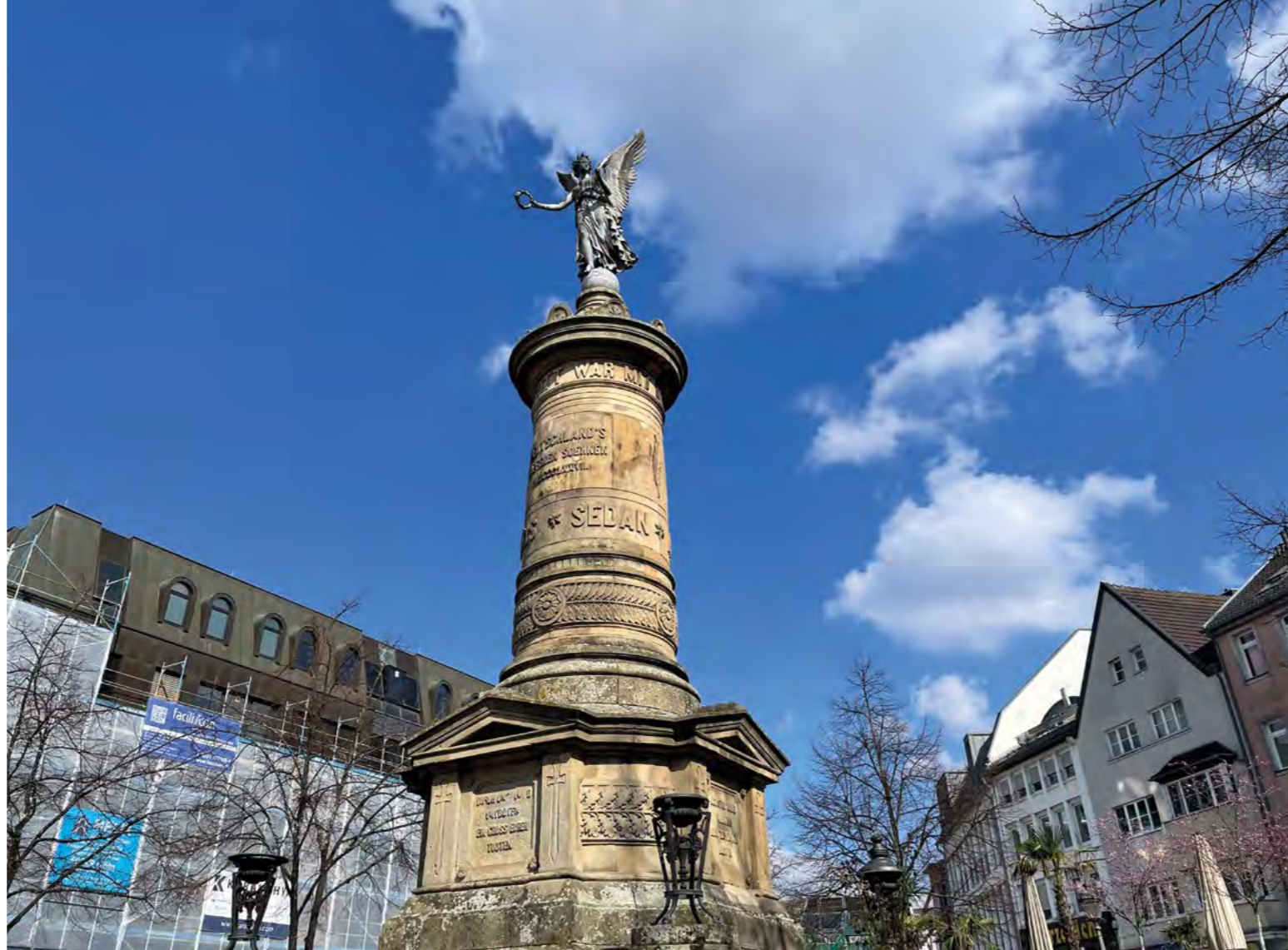
Siegessäule in Siegburg. Wie die Berliner Siegessäule erinnert sie an den Sieg über Frankreich. Auf dem Sockel steht: „Ich zeige nach oben, dem Retter zu loben.“

Sich dem Frieden vom Gedanken des Phänomens des Krieges aus zu nähern war in Deutschland seit dem Ende des 2. Weltkrieges in weiten Teilen der Bevölkerung desavouiert. Infolge der russländischen Invasion in die Ukraine ist schlagartig ein gesellschaftlicher Perspektivenwechsel eingetreten, der jedoch aufgrund eines langen Desinteresses für militärisches Grundwissen fehlerhafte Lagebeurteilungen und Zukunftsängste impliziert, was den Blick in eine mutige und hoffnungsvolle Zukunft zu trüben vermag. Viele „Experten“ werfen hier Nebelkerzen und unterschiedliche Gegner in der hybriden Kriegführung tun ein Übriges. Zum Grundverständnis aller drei Beiträge und fünf kurze Vorbemerkungen: Bündnisverteidigung ist auf das Engste mit der Landesverteidigung verbunden.