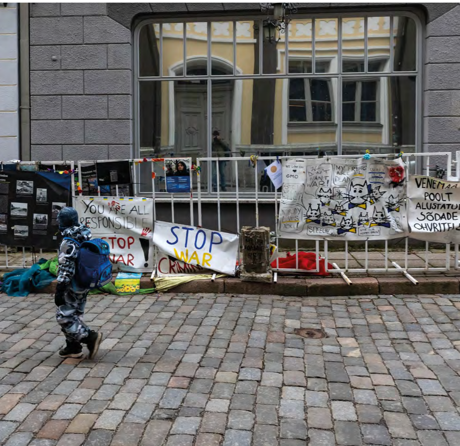
Angesichts der andauernden Kämpfe in der Ukraine und der zunehmenden Bedrohung durch Russland fordern die baltischen Staaten klare, entschlossene Antworten des Westens. Sie sehen den Krieg nicht nur als militärischen Konflikt, sondern als Test für die Fähigkeit Europas und der NATO, ihre Sicherheit zu verteidigen – mit dem Ziel, den Angriff zu beenden, bevor er auf NATO-Territorium übergreift.