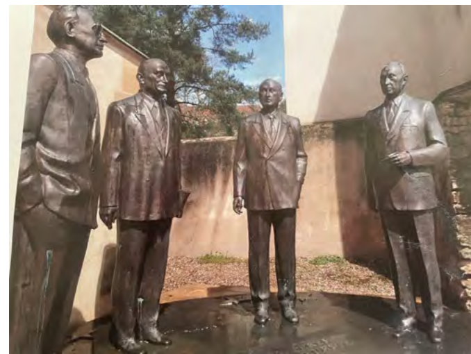
Gruppenbild mit Konrad Adenauer, Jean Monnet, Robert Schuman und Alcide de Gasperi am Centre Européen in Metz. Die Skulptur wurde 2012 von Putin den Europäern geschenkt; die Bodenplatte zeigt die alten Grenzen der Sowjetunion.

Hände unserer Soldaten gelegt!“ Ohne Kriegserklärung und mit der Begründung eines Präventivkrieges begann mit dem „Unternehmen Barbarossa“ das blutigste Kapitel der deutschen Militärgeschichte. Propagandistisch wurde dabei an die Kreuzzüge erinnert, und das gottlose Nazi-System täuschte und missbrauchte dabei auch ihre Bundesgenossen. Das Balkenkreuz zur Identifizierung der eigenen Truppen im Gefecht und das Motto „Gott mit uns“ auf den Koppelschlössern des Heeres verstellten den Blick auf die brutale Wirklichkeit. Als am 22. Juli 1944 die Bombe im Führerhauptquartier gezündet wird, steht Adolf Heusinger neben Hitler und erläutert ihm als Chef der Operationsabteilung des Heeres die katastrophale Lage an der Ostfront. Für diesen Kriegsschauplatz ist das Oberkommando des Heeres zuständig. Heusinger überlebt das Attentat, gerät in den Verdacht der Gestapo und wird bis Kriegsende nicht mehr verwendet. Bei Gründung der Bundeswehr wird er erster Generalinspekteur und ab 1961 Vorsitzender des NATO-Militärausschuss werden.