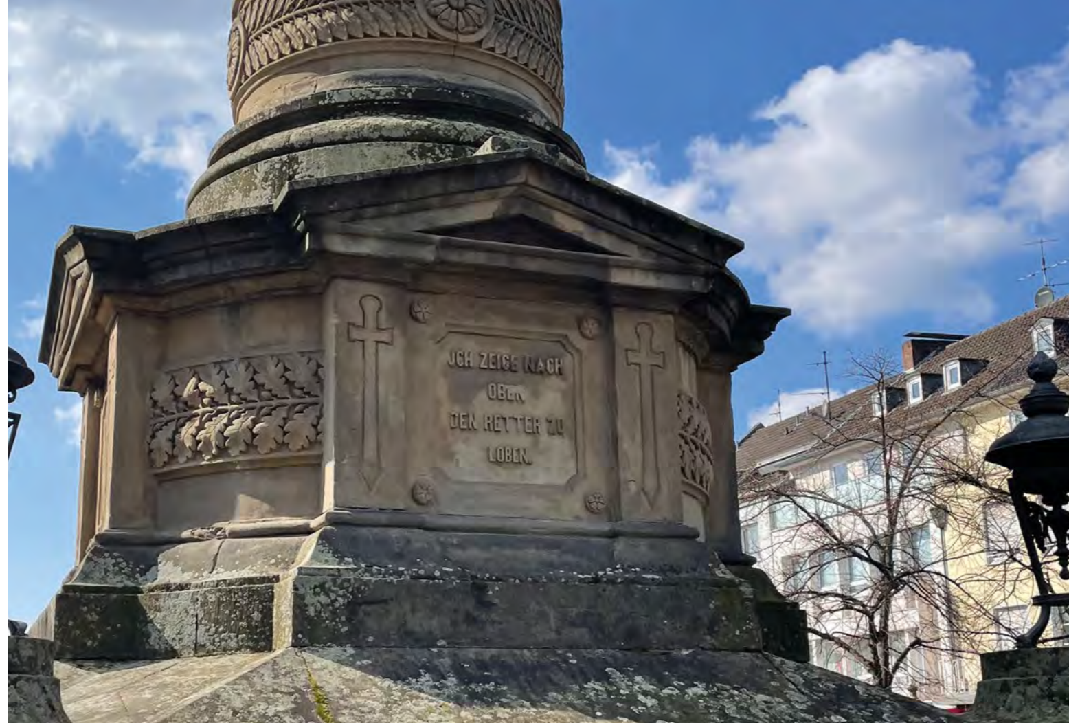
Der untere Teil der Siegessäule in Siegburg.

Ohne Teilnahme der kommenden Supermächte USA und SU (SU wurde 1934 zwar Mitglied, dann aber 1939 aufgrund des Übergriffs auf Finnland ausgeschlossen) und ohne Sanktionsmöglichkeiten war der Völkerbund hilflos, die Katastrophe des nächsten Weltkrieges zu verhindern. So überraschte Hitler am Morgen des 22. Juli 1941 die Weltöffentlichkeit mit folgenden Worten: „Heute habe ich das Schicksal des Deutschen Volkes in die