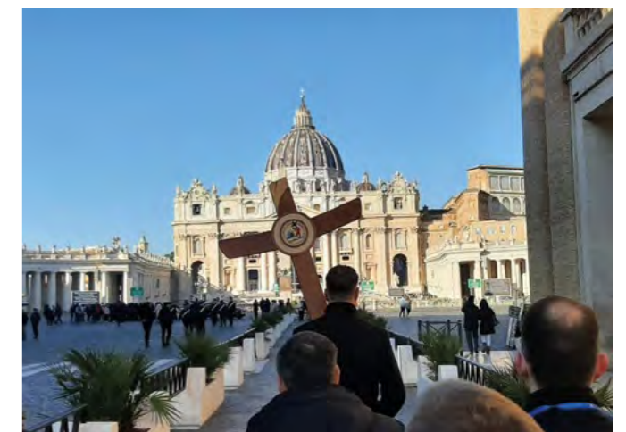
Auf dem Weg zur heiligen Pforte im Petersdom

Am Sonntag, zum Abschluss unserer Pilgerreise, war der Besuch der Papstaudienz auf dem Petersplatz für Sicherheitskräfte aus aller Welt einer der Höhepunkte. Alle Teilnehmer waren sich auf der anschließenden Heimreise einig, dass diese Wallfahrt spirituell prägend und ein wirklich unvergessliches Erlebnis war. Mit dieser Veranstaltung wurde der oft nur schwer zu greifende Begriff „Seelsorge“ vollumfänglich erfüllt. ■